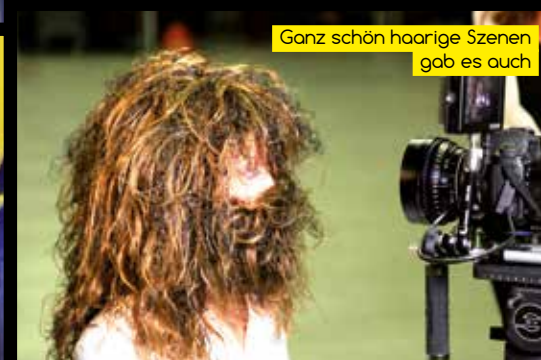
Ganz schön haarige Szenen gab es auch